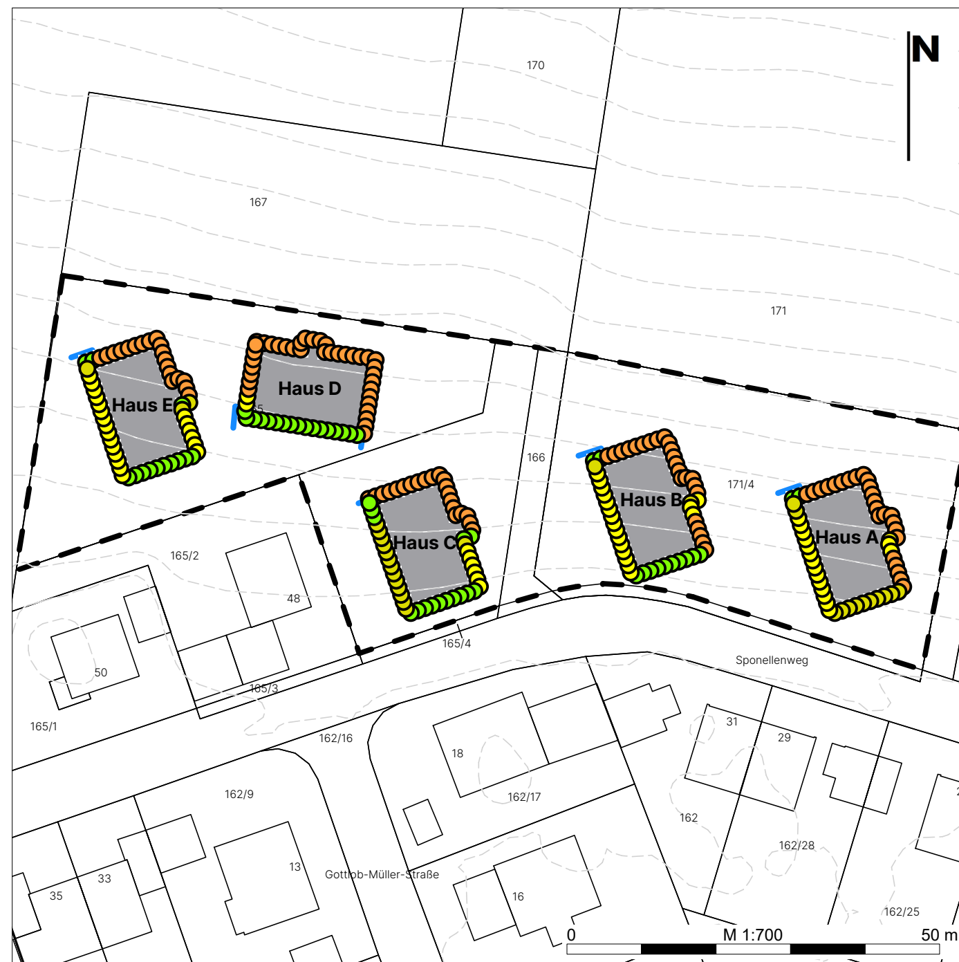
Tagzeitraum (6:00 bis 22:00 Uhr)